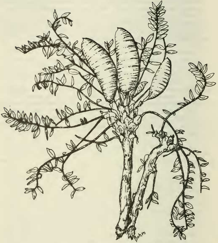
Abb. 2. Astragalus acaulis Baker (FORREST 20731) 2/3 nat. Größe